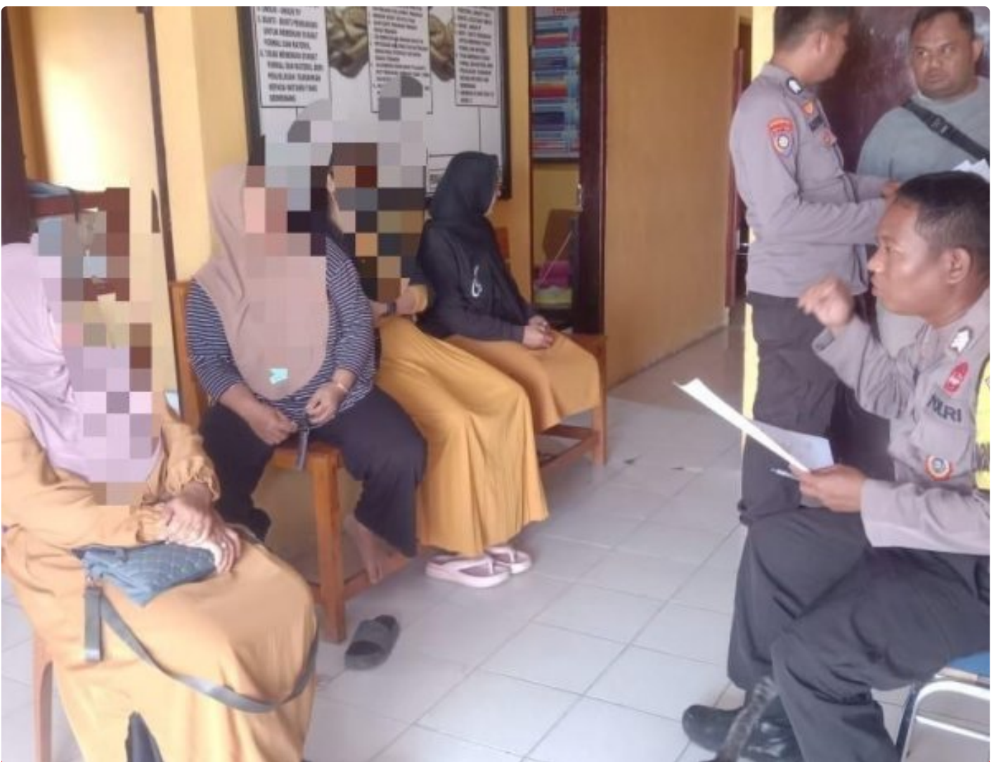
Personel Polsek Bungku Barat Gerak Cepat Lakukan Problem Solving