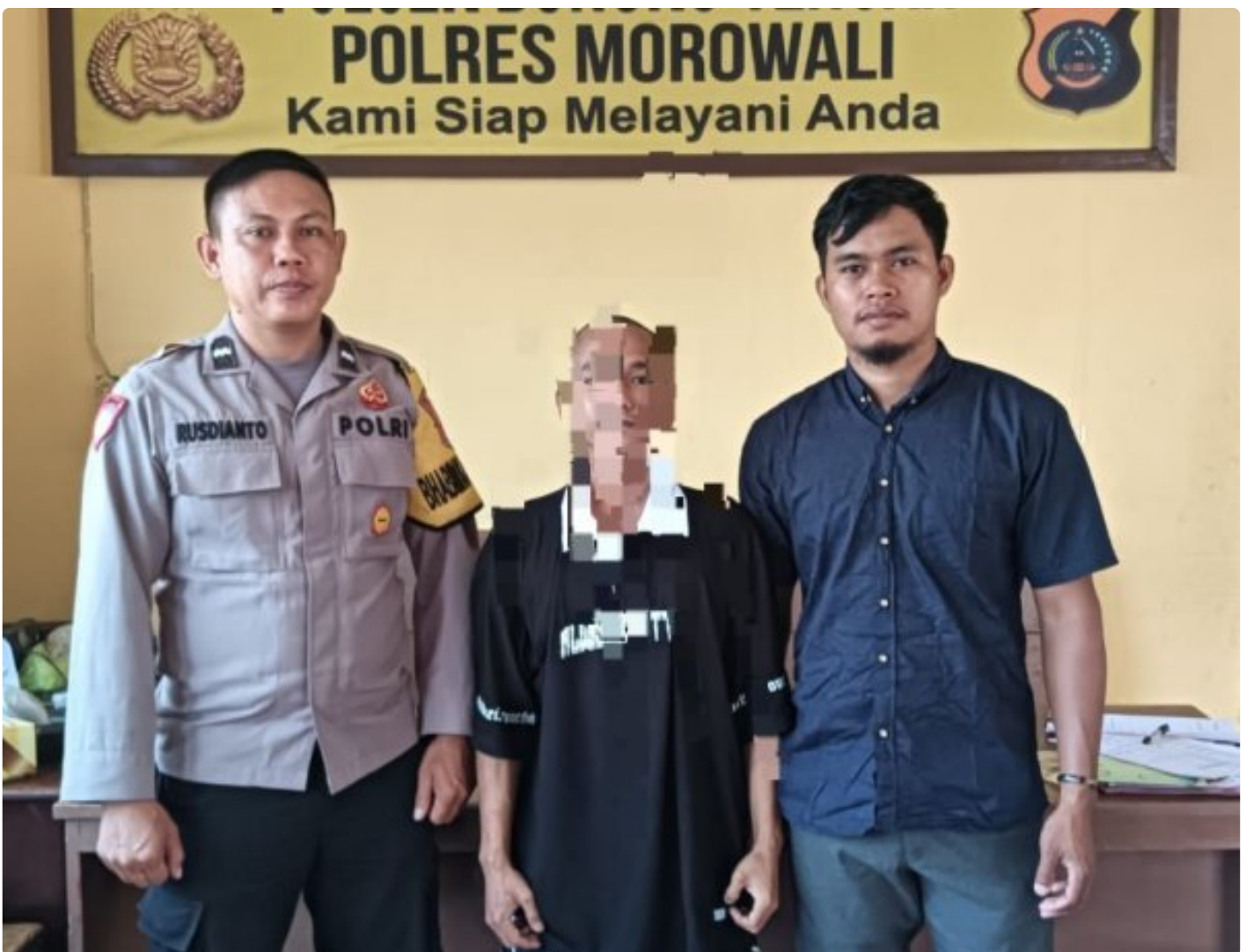
Aparat Polsek Bungku Tengah Berhasil Tangkap Pelaku Curanmor

MOROWALI, Sulawesi Tengah- Pada Hari Sabtu 5 Oktober 2024 Sekitar Pukul 18.30 Wita Kepolisian Sektor (Polsek) Bungku Tengah Polres Morowali, berhasil mengungkap kasus pencurian kendaraan bermotor (curanmor) yang terjadi di